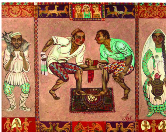
«Борьба» из цикла «Сабантуй» Абзгильдин А.А.

Алып баручы: Сабантуйның иң дулкынландыргыч вакыты житте. Балалар, барыгыз да бүген ярыштыгыз, үзегезнең көчегезне сынадыгыз һәм жиңүчеләр бүләкләр алды. Шуның белән Сабантуйны тәмамлыйбыз. Алда әле безнең бәйрәмнәребез дәвам итә. Без әле шәһәр Сабантуйларында да очрашырбыз. Бәйрәмнәребез мөбәрәк булсын. Әйдәгез Сабантуй батыры белән, Сабантуй гүзәленә лагерь эләмен төшерергә тапшырыйк.